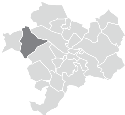
Alt Penedès Torrelles de Foix